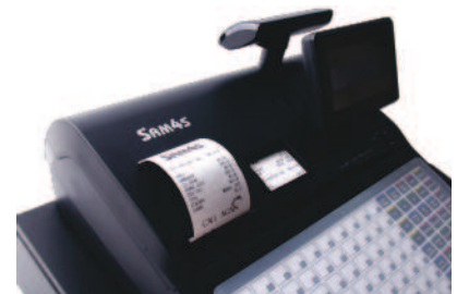
Doble Impresora 57 mm