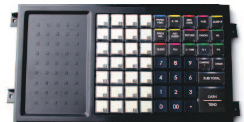
Teclado Elevado 63 Teclas