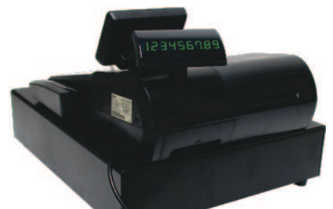
Visor de Cliente Giratorio