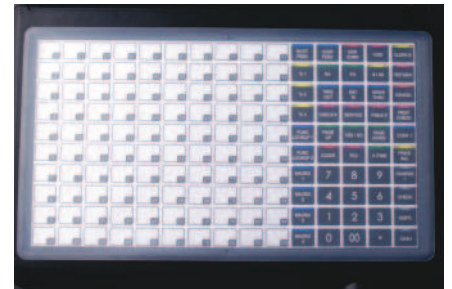
Teclado Plano 150 Teclas