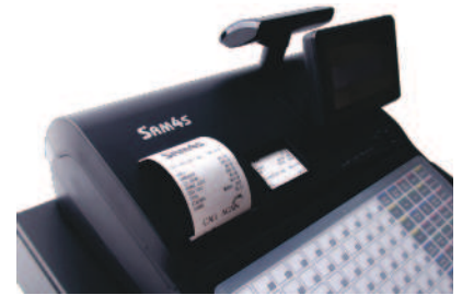
Doble Impresora 57 mm